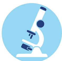
Stiftungseigenes Kompetenzzentrum Mikrobiologie & Hygiene