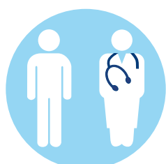
Nutzung ambulanter Behandlungsmöglichkeiten