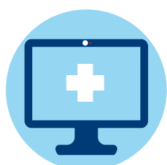
Videosprechstunde und Telekonsil

Sicherheit hat im Krankenhaus gerade jetzt in Zeiten der Corona Pandemie eine besonders hohe Bedeutung.