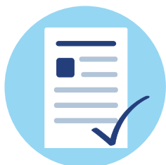
Corona-Tests als Standard für jeden Patienten