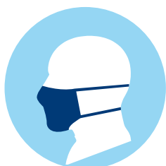
Maskenpflicht und Besuchsregeln