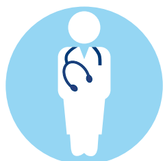
Speziell geschultes Personal